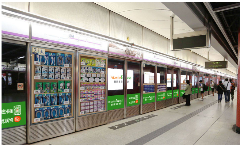
「實惠家居購物牆」(Pricerite Express)位於港鐵將軍澳站月台(往北角方向)，將於 4 月 22 日正式全面啟航。